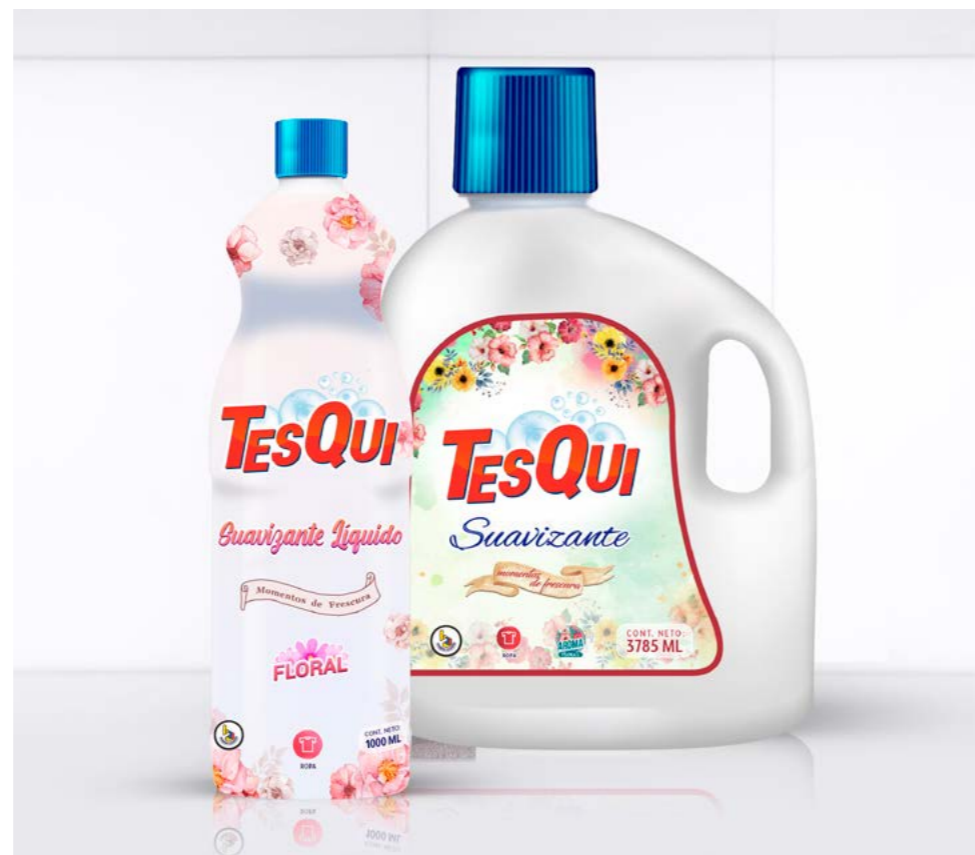
1 Lt. Floral Cód: 02050302