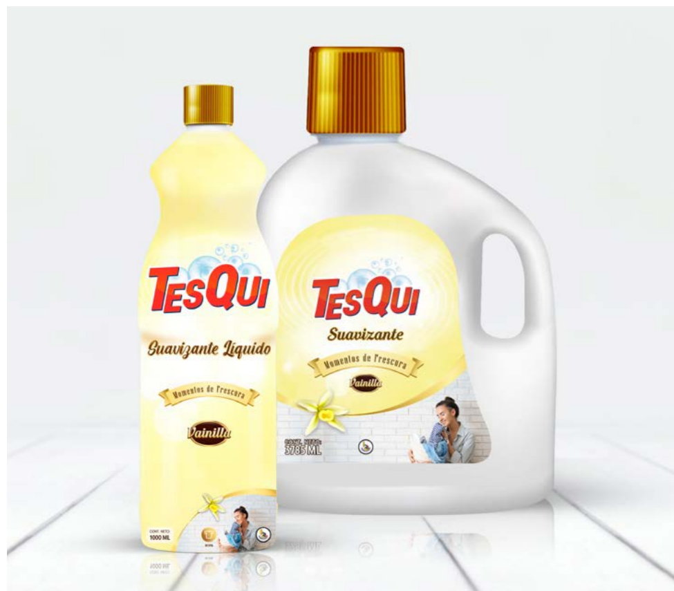
1 Lt. Vainilla Cód: 02050602

Suavizante TESQUI viene en presentaciones de litro y galón.